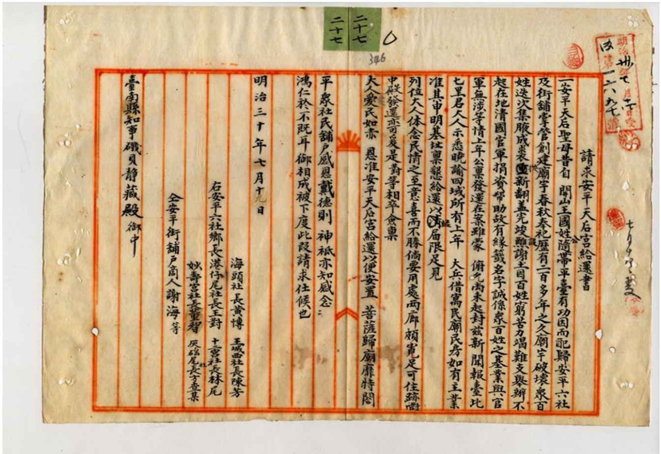
圖 4 安平天后宮歸還請求書

此請求書提出的背景，在於安平天后宮被當做安平郵便電信支局的職員宿舍使用之故。最初日軍佔領臺南時，此天后宮由憲兵隊使用。接著，郵便電信支局在憲兵隊本部撤離時與其交涉，於 1896 年 11 月繼續使用。對該支局的認知而言，繼續使用天后宮一事是所謂官有地的交接，因此聽到六社社長的歸還要求時該支局不啻青天霹靂。但因無「可權充局員宿舍之適當家屋」，因此回覆如果新建官舍落成的