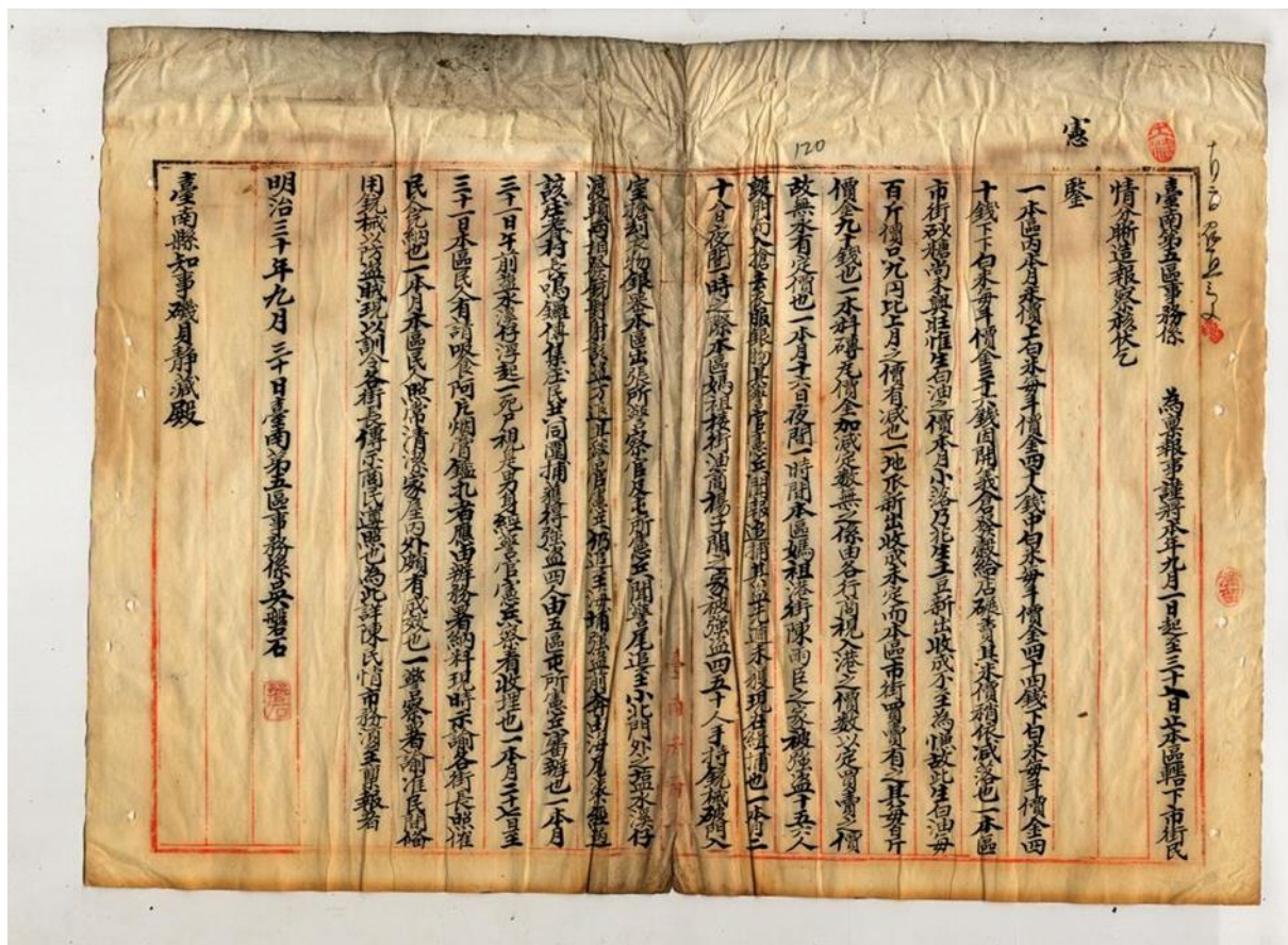
圖 1 臺灣人事務處理委員會向臺南縣知事所提出之報告書（第 5 區，吳磐石。1897 年 9 月 30 日提出）

岡本真希子／殖民地地方行政的開始與臺灣人名望家階層： 統治體制轉換期的臺南地域社會